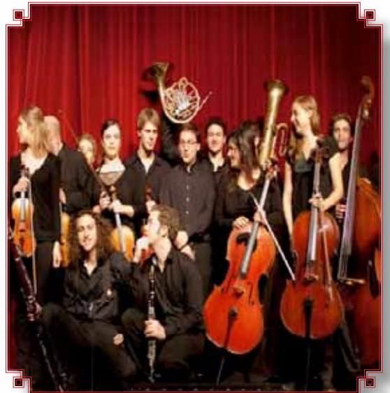
LE FRIVOL' ENSEMBLE